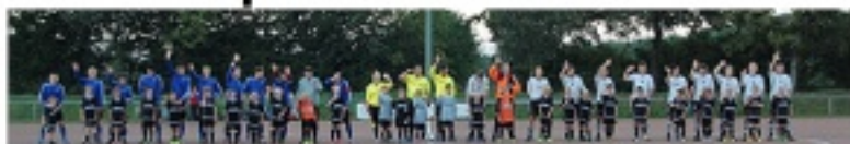
Fußball in Hoisbüttel von der G-Jugend bis zu den Senioren!