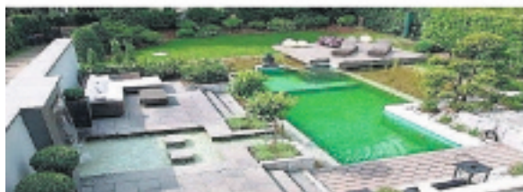
Erstellt von Pirna Kollgens Garten- und Landschaftsbau

Baustoffe von A - Z für Haus und Garten.