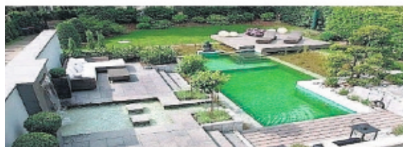
Erstellt von Firma Rathjens Garten- und Landschaftsbau

Wir haben alles was Sie brauchen, was wir nicht haben, brauchen Sie auch nicht!